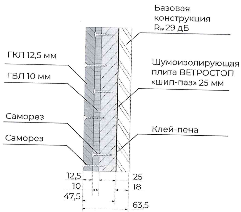
Рис. 2 Эскиз конструкции для дополнительной звукоизоляции (модуль №2)